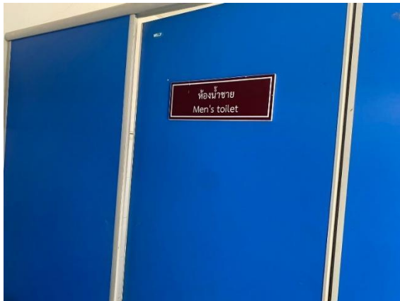
รูปถ่ายผลการดำเนินงานจริง ณ จุดบริการ ของสถานีตำรวจ