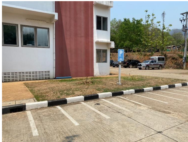
รูปถ่ายผลการดำเนินงานจริง ณ จุดบริการ ของสถานีตำรวจ