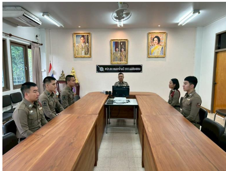
รูปถ่ายผลการดำเนินงานจริง ณ จุดบริการ ของสถานีตำรวจ