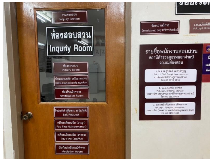
รูปถ่ายผลการดำเนินงานจริง ณ จุดบริการ ของสถานีตำรวจ