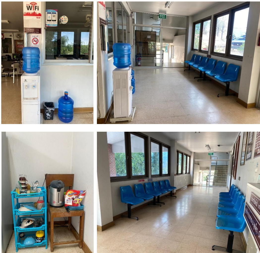
รูปถ่ายผลการดำเนินงานจริง ณ จุดบริการ ของสถานีตำรวจ