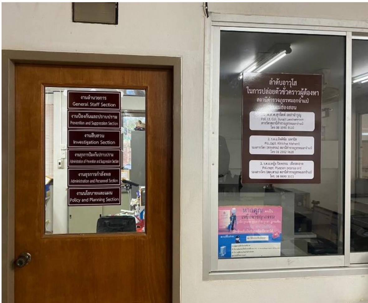
รูปถ่ายผลการดำเนินงานจริง ณ จุดบริการ ของสถานีตำรวจ